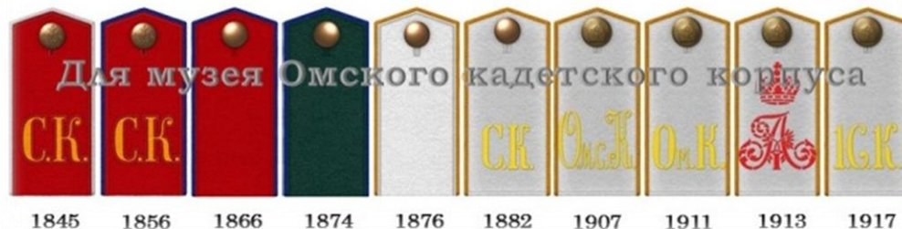
Погоны кадет (воспитанников) Сибирского (Омского) кадетского корпуса 1845-1925 г.г.