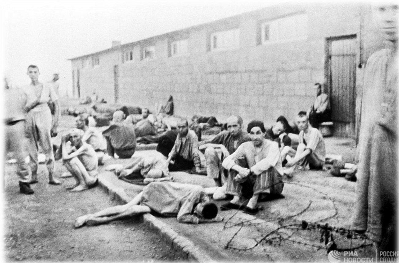
Узники немецкого концентрационного лагеря Маутхаузен.

Дмитрий Карбышев содержался в лагере для военнопленных Шталаг-324 близ города Острув-Мазовецка , в тюрьме гестапо в Берлине , в лагере на пересыльном пункте РОА в Бреслау , в немецких концентрационных лагерях: Замосць, Хаммельбург, Флоссенбург, Майданек, Освенцим (Аушвиц), Заксенхаузен, Маутхаузен . Последним местом заключения стал концлагерь Маутхаузен , расположенный в коммуне Маутхаузен земельного района Перг рейхсгау Верхний Дунай Великогерманской империи (ныне округ Перг входит в федеральную землю Верхняя Австрия Австрийской Республики ).