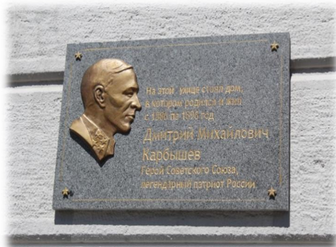
Мемориальная доска на фасаде дома в г. Омске, который находится на месте дома, где Д.М. Карбышев провел детство