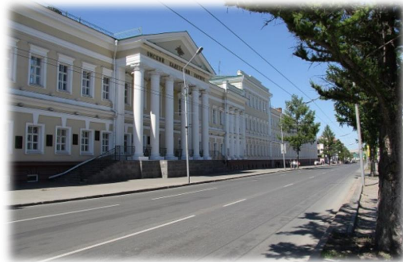
Здание Омского (ранее – Сибирского) кадетского корпуса