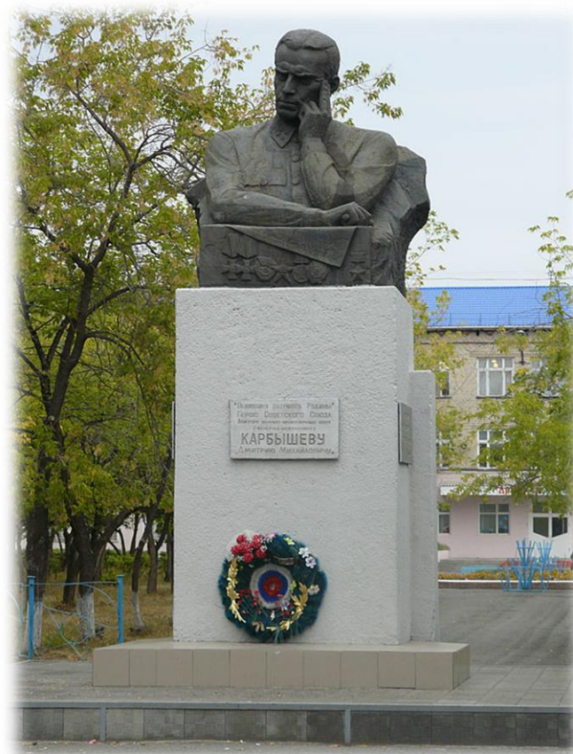
Памятник Д. М. Карбышеву в Кургане.

Последние слова генерала Карбышева были обращены к тем, кто разделял вместе с ним страшную смерть: «Бодрей, товарищи! Думайте о Родине, и мужество не покинет вас!»