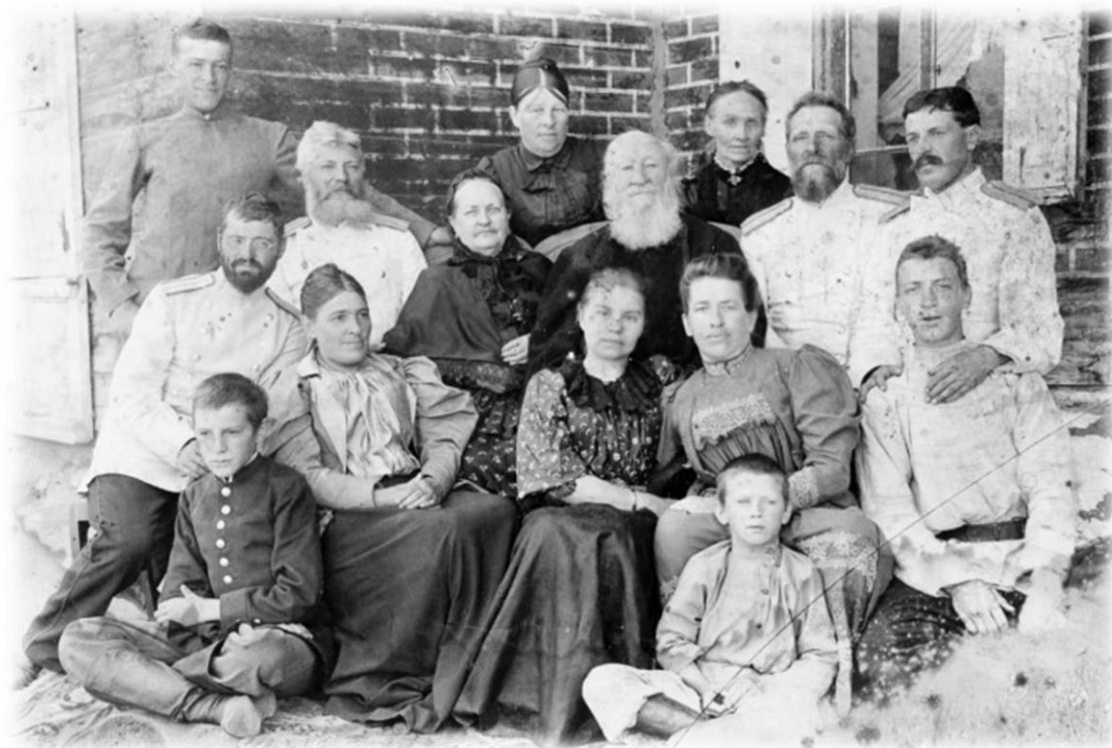
Кадет Сибирского кадетского корпуса (Омск) Дмитрий Карбышев (стоит крайний слева) с родственниками. 1897 год

Решивший пойти по стопам отца и деда Дмитрий поступает в Сибирский кадетский корпус . Увы, рассчитывать на государственную стипендию Карбышев не мог. Осознавая, что мать отдаст за его обучение последние деньги, Дмитрий приложил максимум усилий, чтобы выбиться в лучшие ученики. В 1898 году заканчивает кадетский корпус «с отличием»