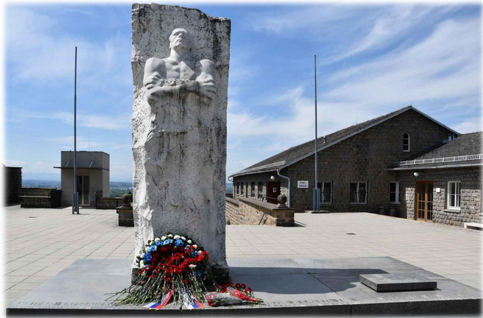
Памятник Д. Карбышеву на территории бывшего концлагеря Маутхаузен