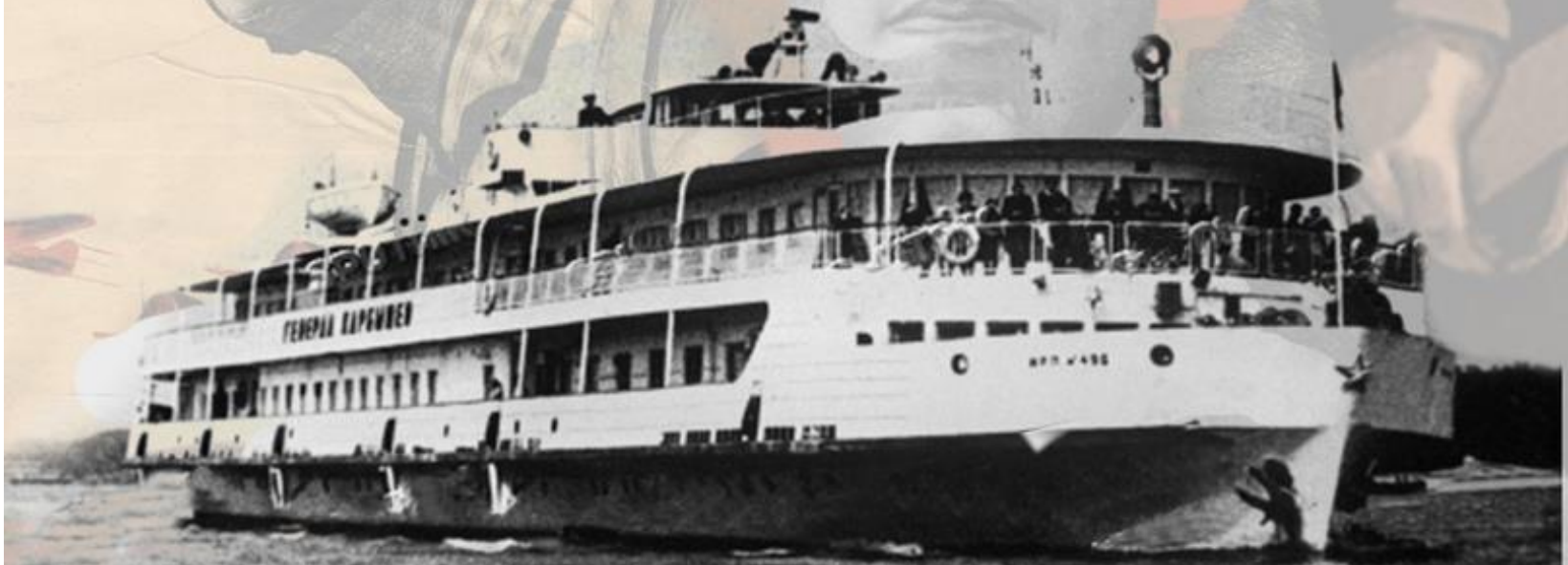
Пассажирский теплоход «Генерал Карбышев»